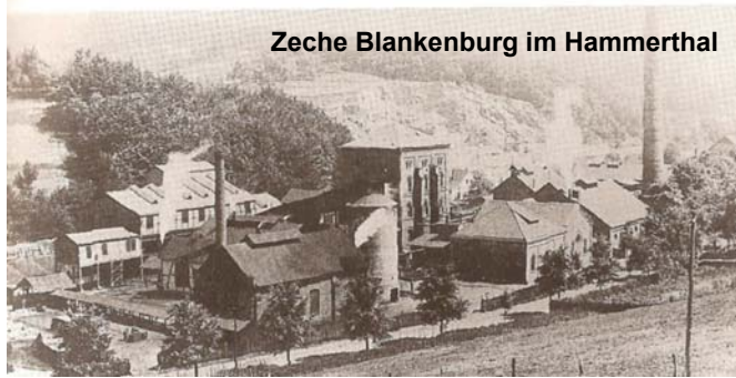
Zeche Blankenburg im Hammerthal