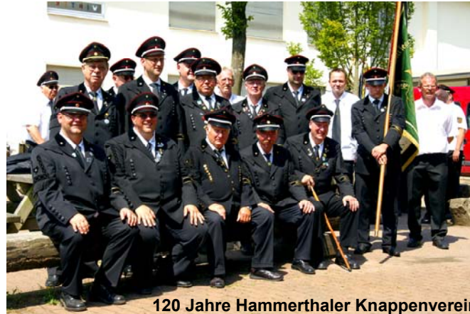
120 Jahre Hammerthaler Knappenverein

Um diese Ziele zu erreichen, nehmen wir an regionalen Veranstaltungen teil, tragen Dokumente zusammen, betreiben Öffentlichkeitsarbeit und dokumentieren die Erinnerungen der ehemals aktiven Bergkameraden in Schrift und Bild. Darüber hinaus organisieren wir Fahrten und Ausflüge für die Mitglieder, deren Familien und Freunde.