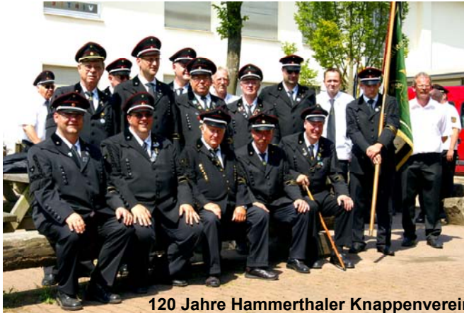
120 Jahre Hammerthaler Knappenverein

Um diese Ziele zu erreichen, nehmen wir an regionalen Veranstaltungen teil, tragen Dokumente zusammen, betreiben Öffentlichkeitsarbeit und dokumentieren die Erinnerungen der ehemals aktiven Bergkameraden in Schrift und Bild. Darüber hinaus organisieren wir Fahrten und Ausflüge für die Mitglieder, deren Familien und Freunde.